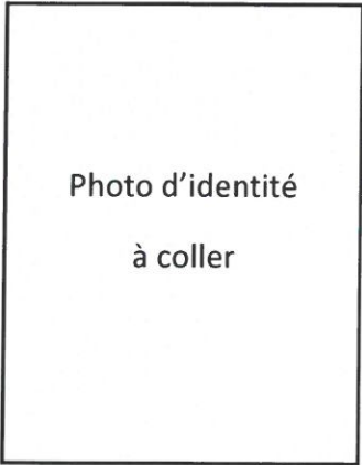
Photo d'identité à coller